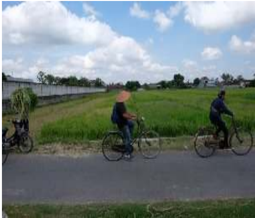
Gambar 6. Jalan Menuju Objek Wisata

Objek wisata Taman Bronjong terletak di Desa Wanujoyo Kidul kecamatan Piyungan. \pm 14,5 Kilometer dari kota Jogja.