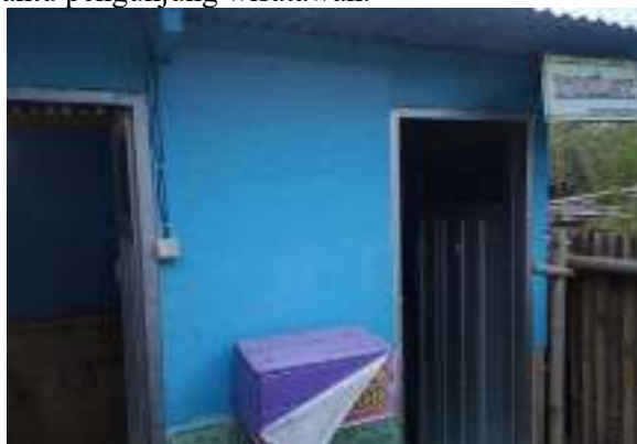
Gambar 9. Toilet Umum

Objek Wisata Taman Bronjong terdapat toilet umum yang disediakan sebagai sarana penunjang wisata, agar wisatawan dapat menggunakan fasilitas penunjang yang ada. Adanya fasilitas toilet umum ini cukup membantu pengunjung wisatawan.