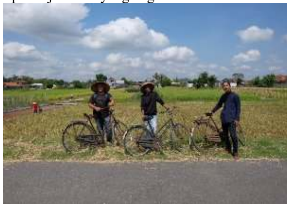
Gambar 7. Kondisi Jalan

Infrastruktur jalan dari kota Jogja ataupun dari bandara menuju objek wisata Taman Bronjong memiliki akses yang sangat baik karena memiliki jalan dengan aspal yang halus dan cukup lebar serta adanya rambu- rambu penunjuk arah yang begitu memadai.