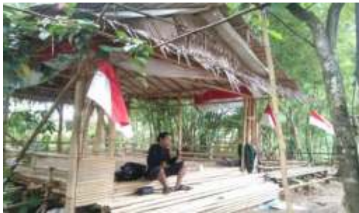
Gambar 12. Gazebo

Dalam Objek Wisata Taman Bronjong tersedia tempat bersantai berupa gazebo. Gazebo ini terdapat di beberapa titik lokasi wisata. Adanya gazebo ini sangat menunjang pariwisata karena pengunjung tidak susah untuk mencari tempat bersantai.