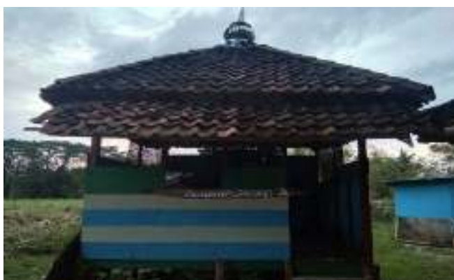
Gambar 10. Mushola

Objek Wisata Taman Bronjong terdapat Mushola yang disediakan sebagai sarana penunjang wisata, agar wisatawan dapat menggunakan Mushola tersebut untuk berdoa. Adanya fasilitas Mushola ini cukup membantu pengunjung wisata ,karena wisatawan yang datang bias melakukan ibadah sholat dengan nyaman.