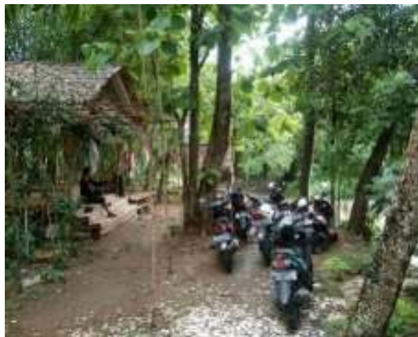
Gambar 8. Area Parkir