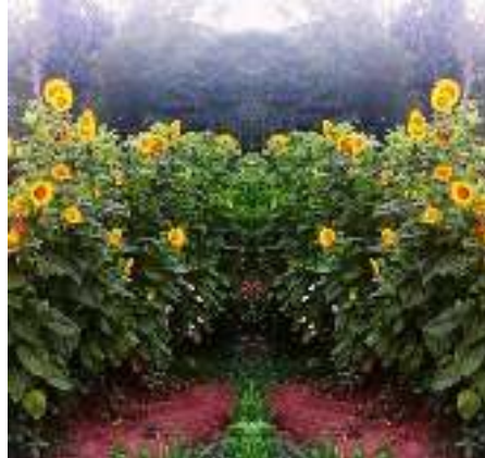
Gambar 3. Taman Bunga

Terdapat taman di wisata lokasi wisata Taman Bronjong. Taman ini menjadi salah satu daya Tarik wisata yang ada di Kecamatan Piyungan Kabupaten Bantul. Bisa dibilang, taman ini menjadi destinasi wisata baru di Kabupaten Bantul khususnya Kecamatan Piyungan ,desa Wanujoyo Kidul. Terdapat berbagai jenis tanaman yang ada di taman ini ,mulai dari bunga, tanaman buah dan sayur serta tanaman herbal. Tanaman ini menjadi daya Tarik tersendiri dari taman ini.