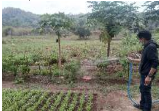
Gambar 4. Kebun sayur di lokasi wisata Taman Bronjong

Terdapat Kebun sayur di lokasi wisata Taman Bronjong, Kebun sayur ini menjadi salah satu daya Tarik Wisata yang ada di Taman Bronjong, dengan adanya kebun sayur ini pengunjung bisa berwisata sambil belajar berkebun,