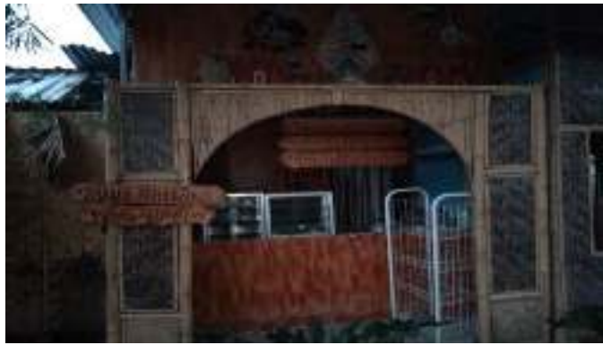
Gambar 11. Rumah makan