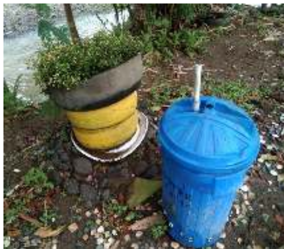
Gambar 13. Tempat sampah

Dalam Objek Wisata Taman Bronjong, tersedia tempat sampah di beberapa titik lokasi wisata digunakan untuk menampung sampah yang dihasilkan dari aktifitas wisata.