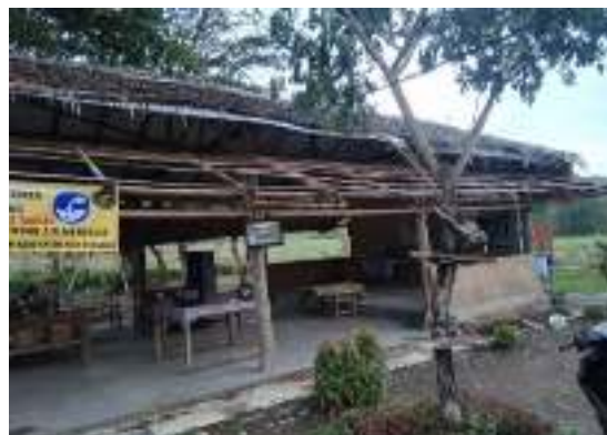
Gambar 15. Aula

Pengelola Objek Wisata Taman Bronjong telah menyediakan tempat untuk berkumpul dan beristirahat jika wisatawan datang secara rombongan di satu titik lokasi wisata. Kondisi tempat peristirahatan relative baik.