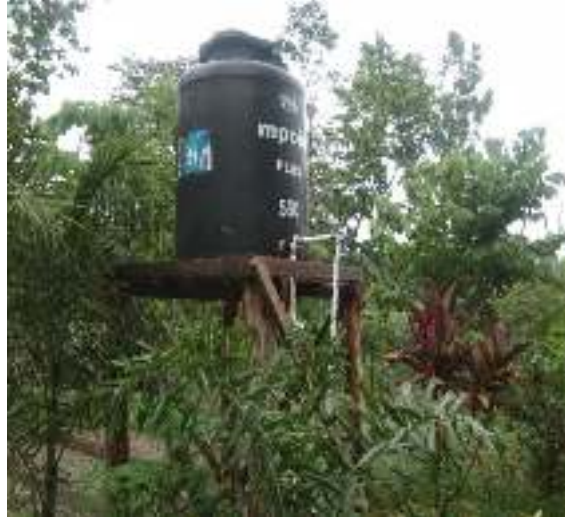
Gambar 14. Air Bersih

Pengelola wisata menyediakan air bersih yang berasal dari sumur bor dan di tampung dalam tendon air kemudia dialirkan menuju toilet dan taman. Adanya air bersih ini sangat mendukung pariwisata.