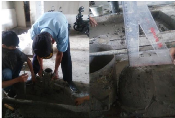
Gambar Pengujian Workability Nilai Uji Slump

Berdasarkan Nilai Workability uji slump beton yang dengan campuran yang berbeda – beda yaitu: